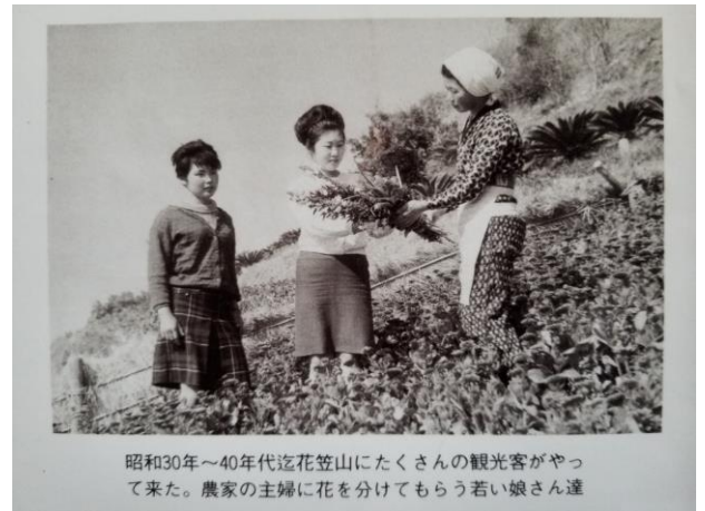
昭和30年～40年代迄花笠山にたくさんの観光客がやって来た。農家の主婦に花を分けてもらう若い娘さん達