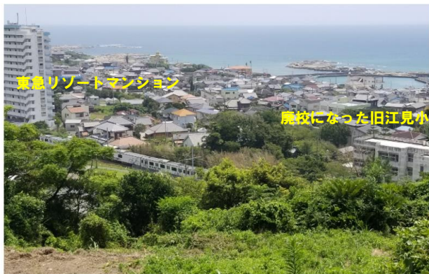
花笠山頂上から自転車専用列車 B.B.BASE を撮影(2020.8.10) 山道と山頂を整備し、津波緊急避難場所を確保します。

「花のまち江見復活」と「地域の安全確保」を目指して取り組んで参りますので、皆様のご理解・ご協力をいただければ幸いです。