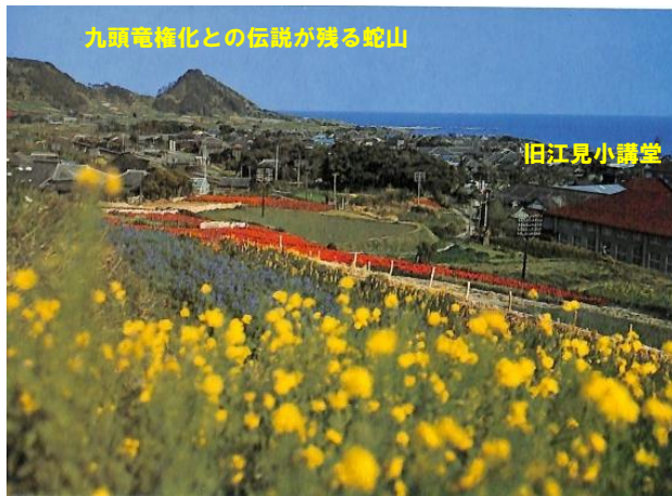
花笠山中腹からの風景 昭和44年頃